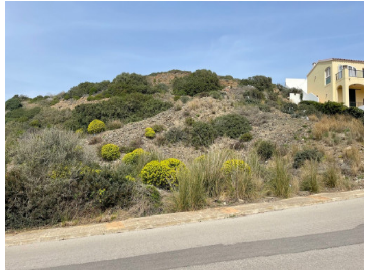
View of the plot

All information is correct to the best of our knowledge. Errors and prior sale excepted. This prospectus is purely for information purposes. Only the notarized deed of sale is legally binding.