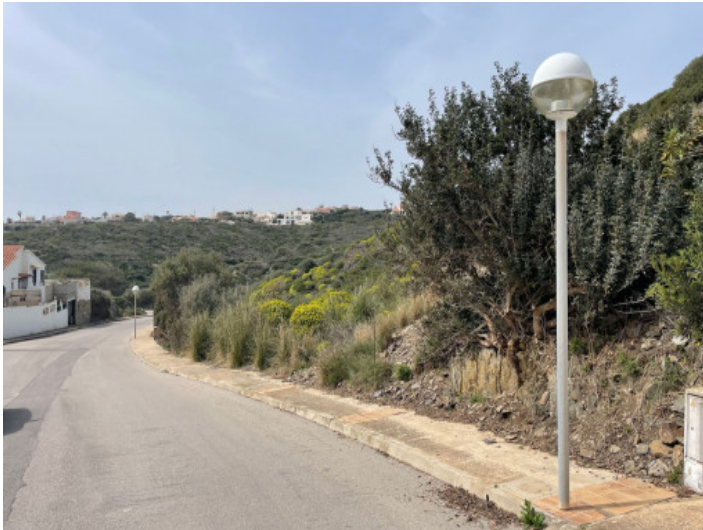
View of the plot