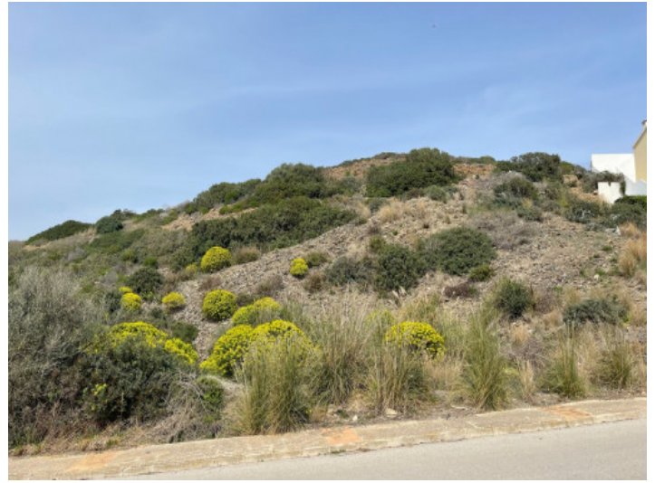
View of the plot