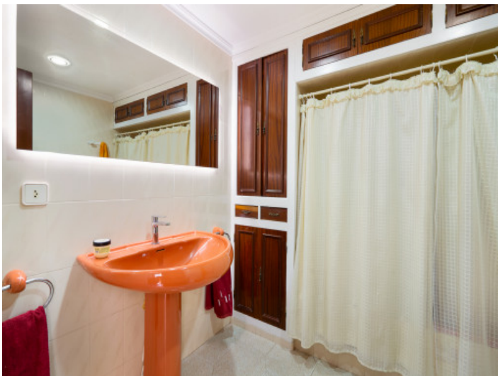
One of 2 bathrooms