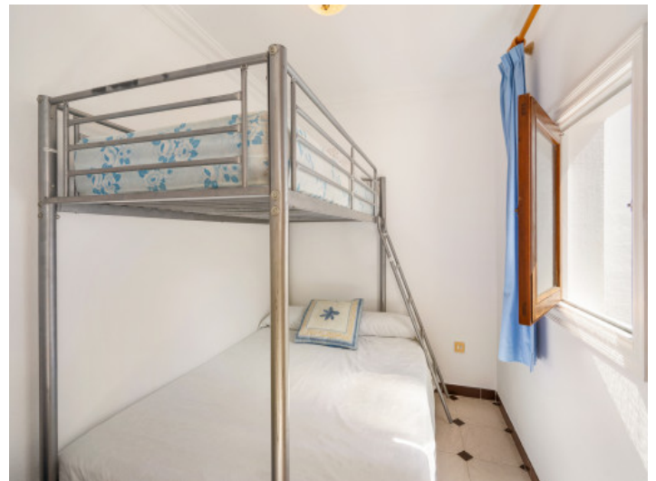
One of 3 bedrooms