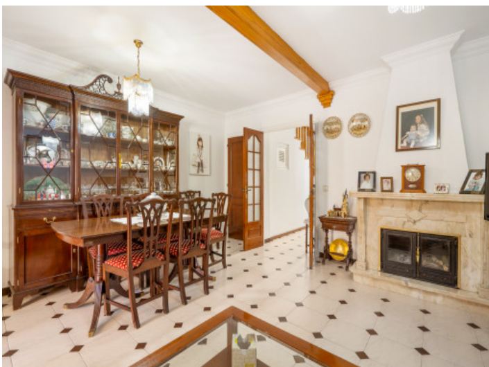
Beautiful dining area