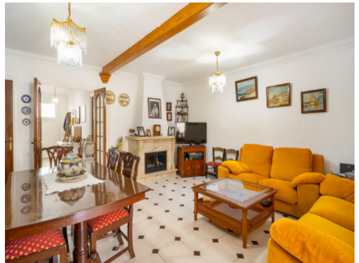
Living area with fireplace