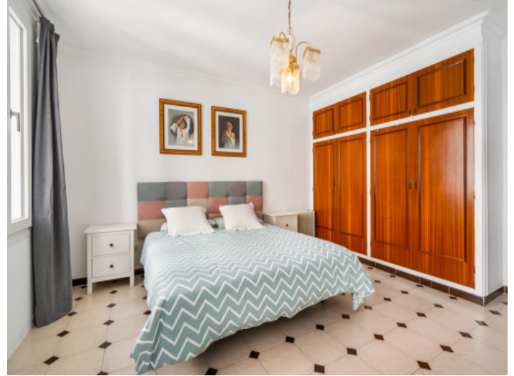
One of 3 bedrooms