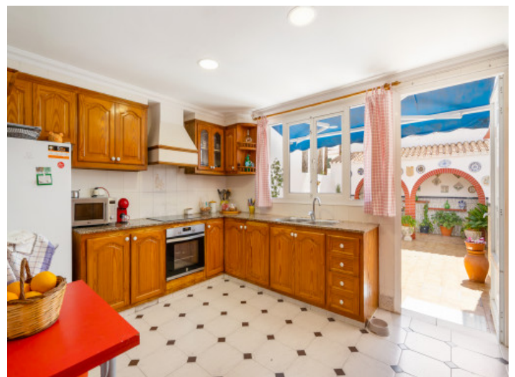
Fully equipped kitchen

All information is correct to the best of our knowledge. Errors and prior sale excepted. This prospectus is purely for information purposes. Only the notarized deed of sale is legally binding.