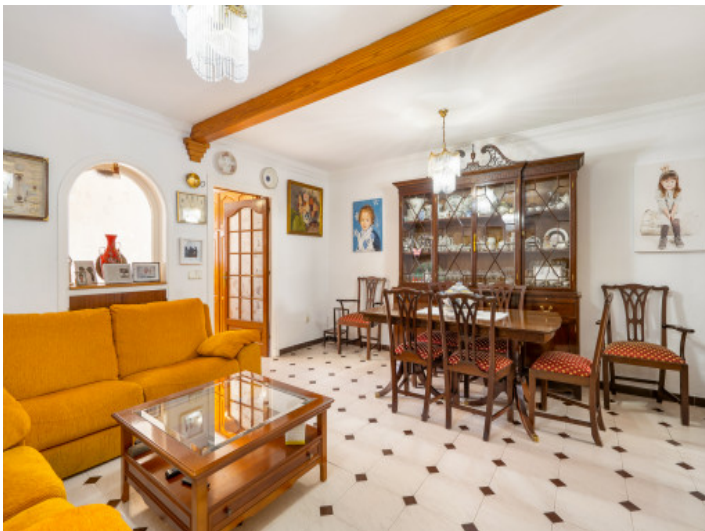
Living and dining area