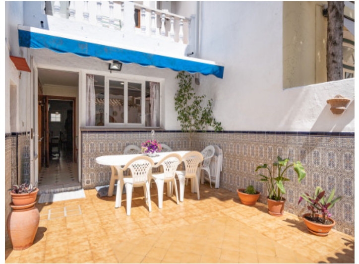
Sunny terrace with awning