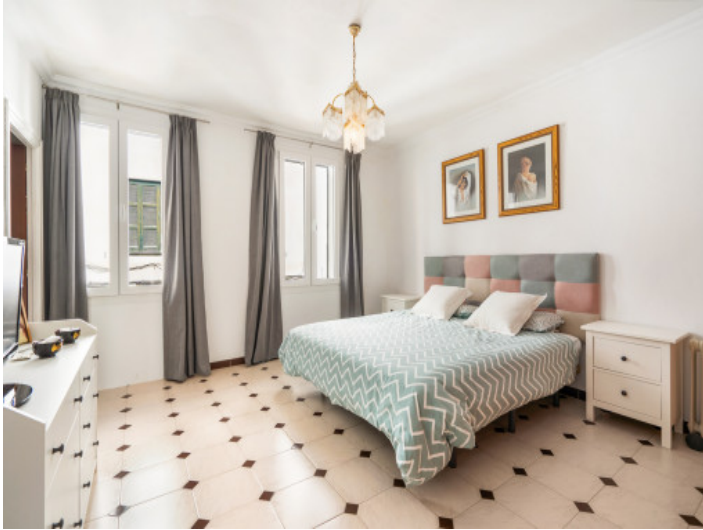
One of 3 bedrooms