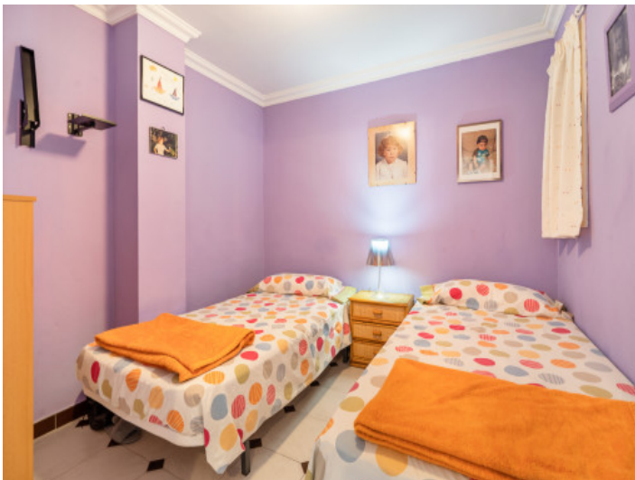
One of 3 bedrooms