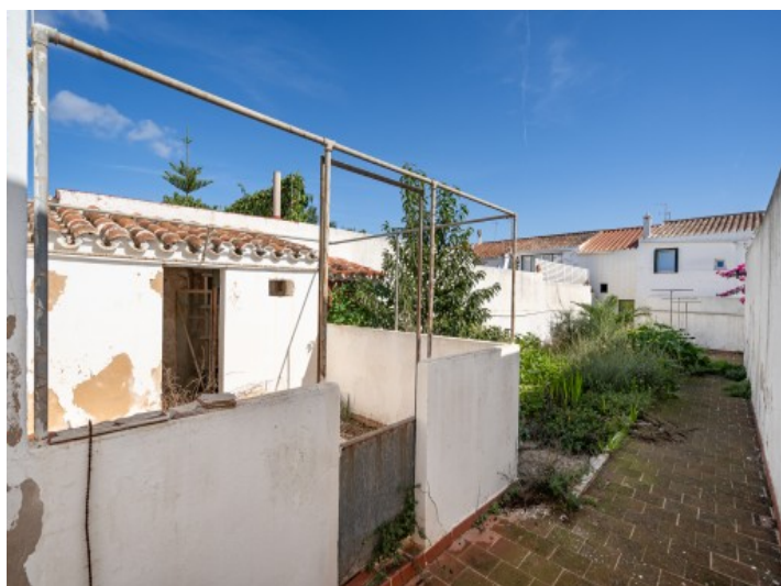
Terrace and garden