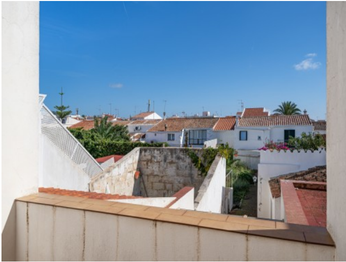
Balcony and view