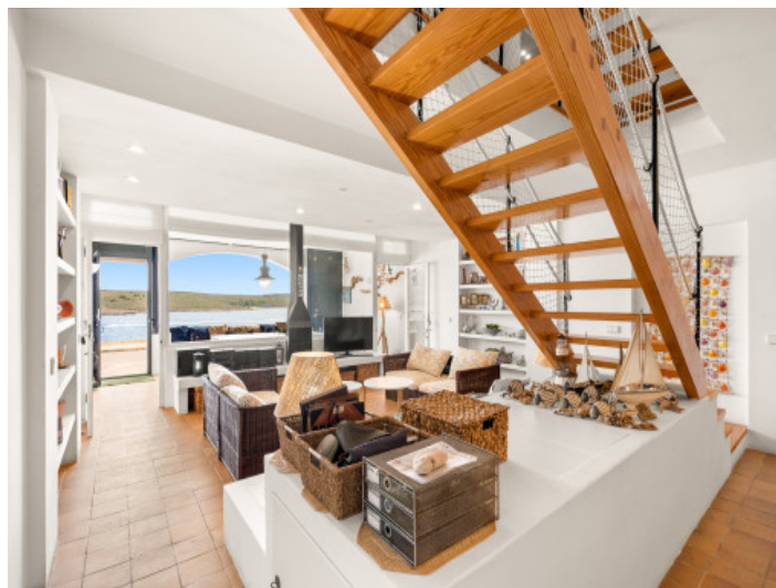
Vue sur la mer