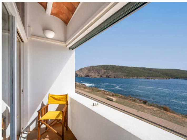
Vue sur la mer