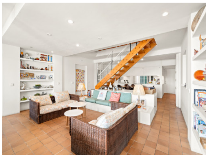
Espace de vie ouvert