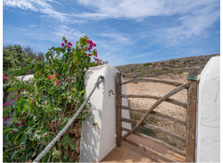
Accès au Cami de Cavalls