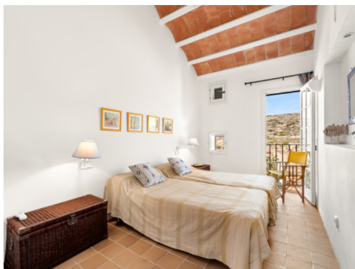
Chambre à coucher double avec balcon

All information is correct to the best of our knowledge. Errors and prior sale excepted. This prospectus is purely for information purposes. Only the notarized deed of sale is legally binding.