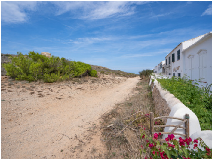
Vue latérale de la maison