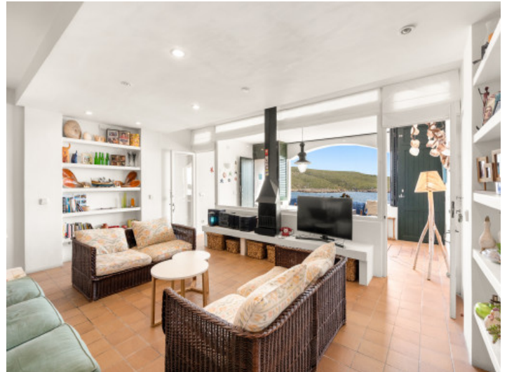
Salle de séjour