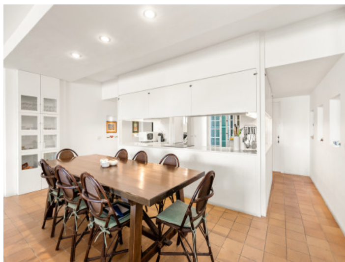
Coin repas et cuisine