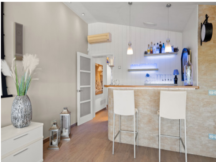
Bar Upper floor