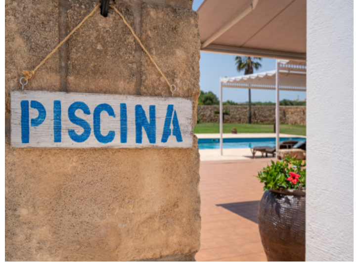
Access to the pool