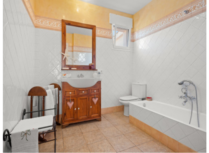
Bathroom with bathtub