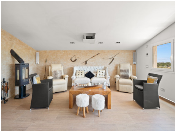
Beautiful seating area with fireplace