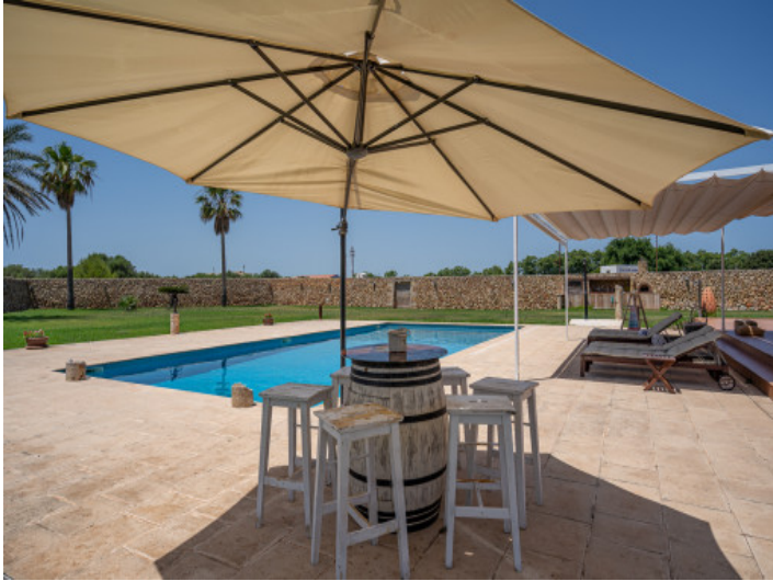
Beautifully laid-out pool area