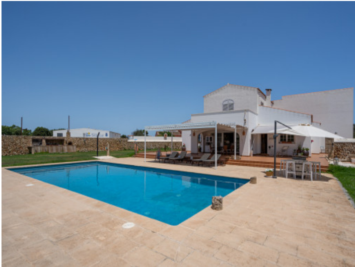
View of the finca with pool and terraces