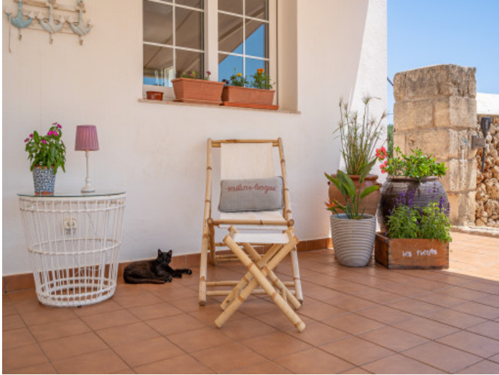
Idyllic terrace with shade