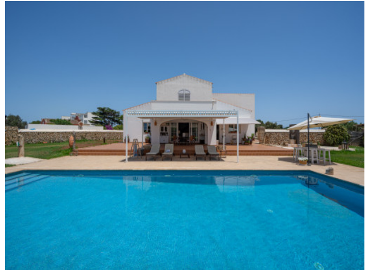
Large pool and terrace area