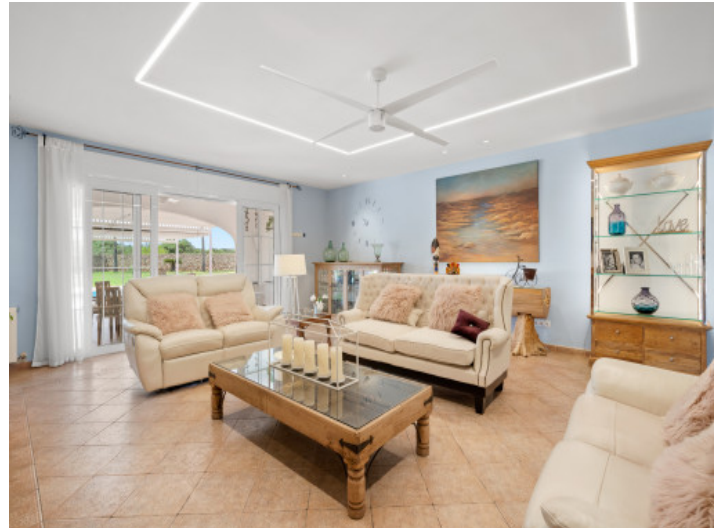
Lightflooded living area with terrace access