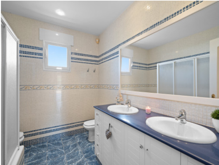
One of 3 bathrooms