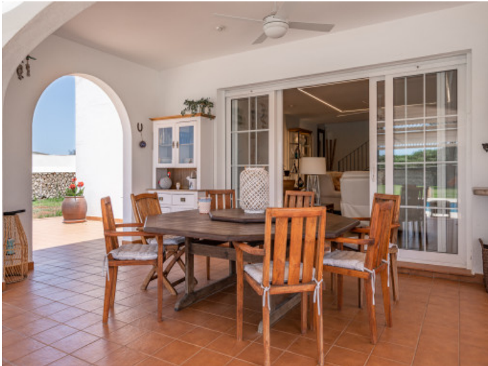
Covered terrace with dining area