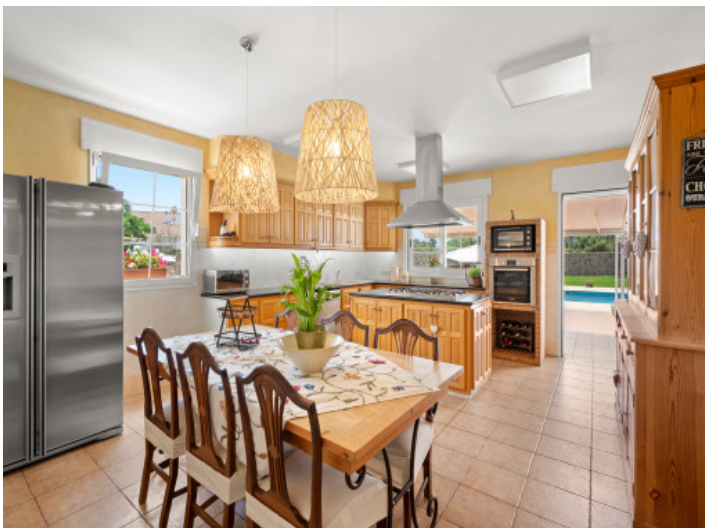
Beautiful, open dining area and kitchen