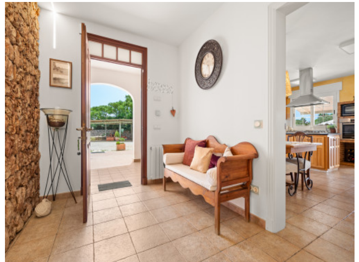
Inviting entrance to the finca

All information is correct to the best of our knowledge. Errors and prior sale excepted. This prospectus is purely for information purposes. Only the notarized deed of sale is legally binding.