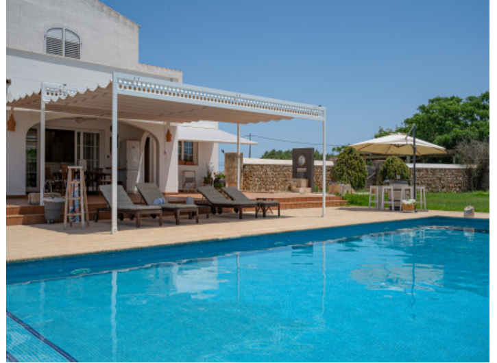
Large pool with sun terrace