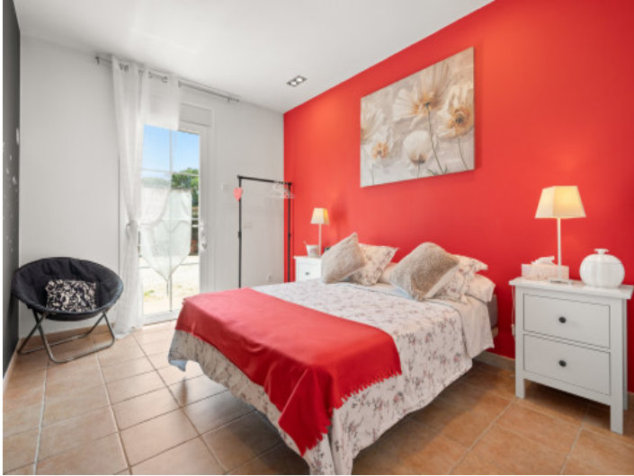
One of 5 bedrooms