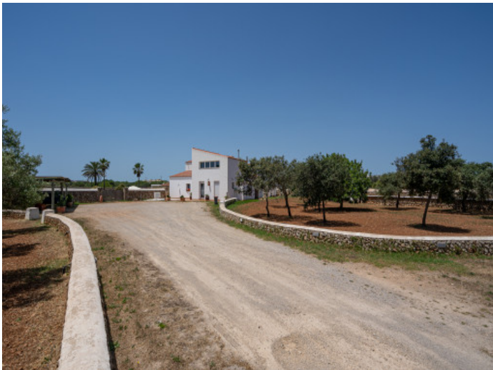
Driveway to the finca