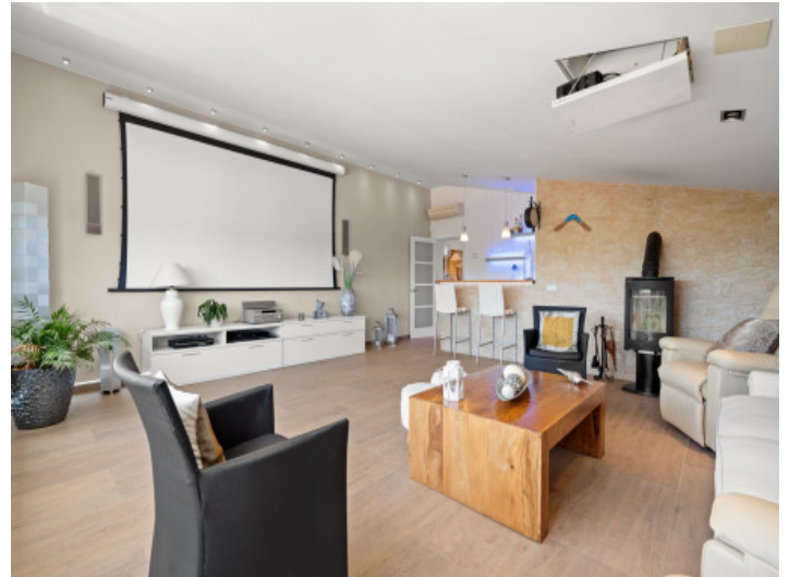
Home cinema with bar on the upper floor