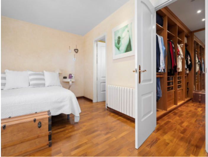
Bedroom and dressing room