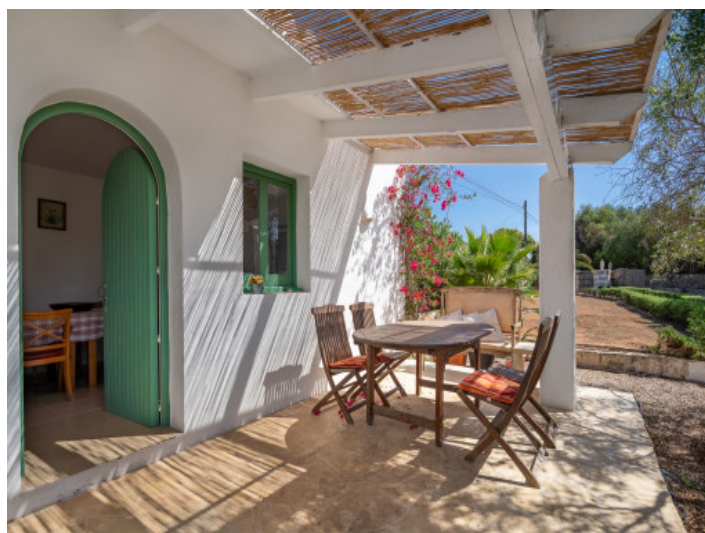
Autre bâtiment avec salon et chambre à coucher