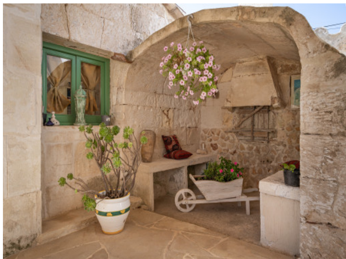
Magnifique poêle à bois