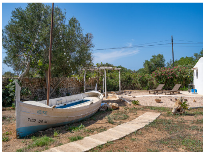
Grand espace extérieur avec jardin