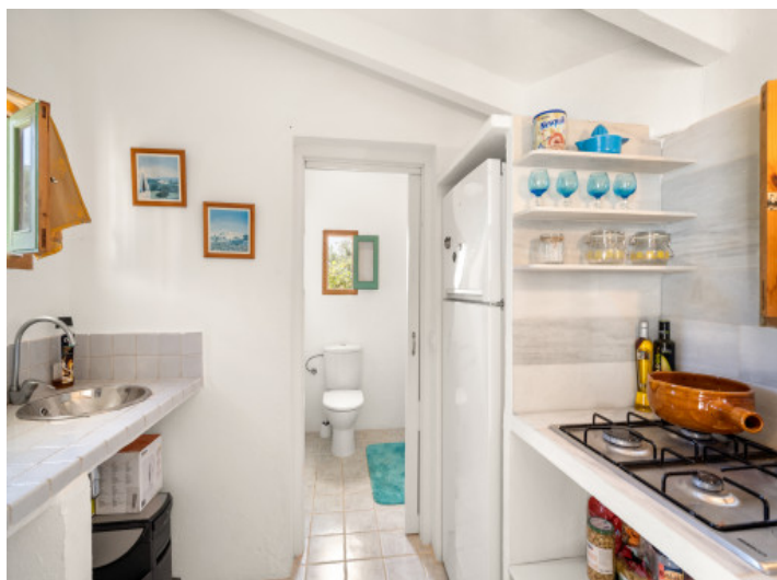
Petite cuisine avec salle de bain