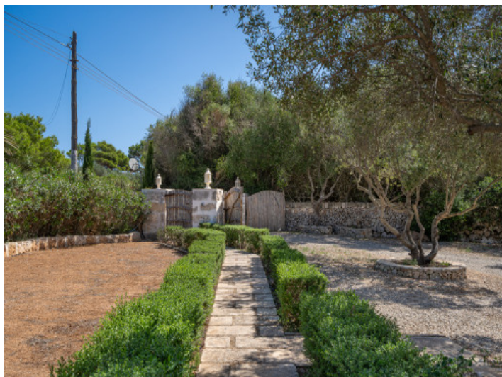
Accès à la propriété

All information is correct to the best of our knowledge. Errors and prior sale excepted. This prospectus is purely for information purposes. Only the notarized deed of sale is legally binding.