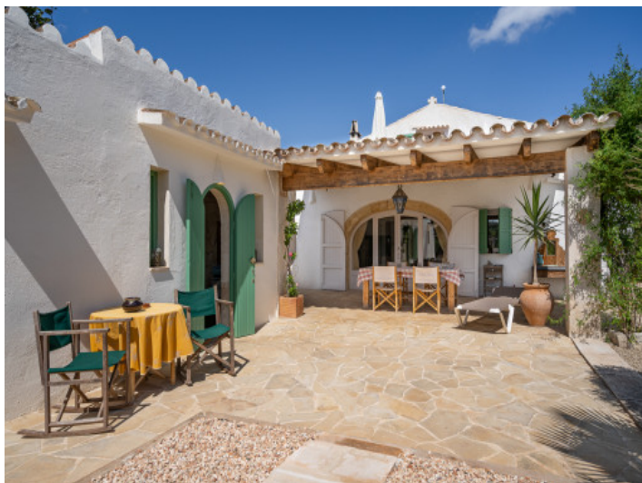
Charmante finca entièrement restaurée avec vue sur la mer et le jardin à la