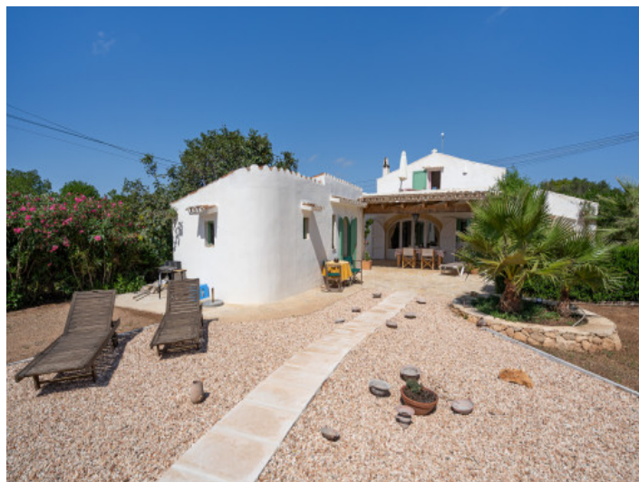
Vue et terrasse