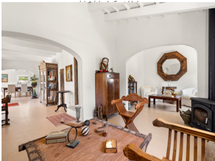
Espace de vie ouvert