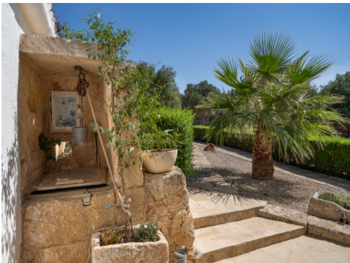
Fontaine originale à côté de la terrasse