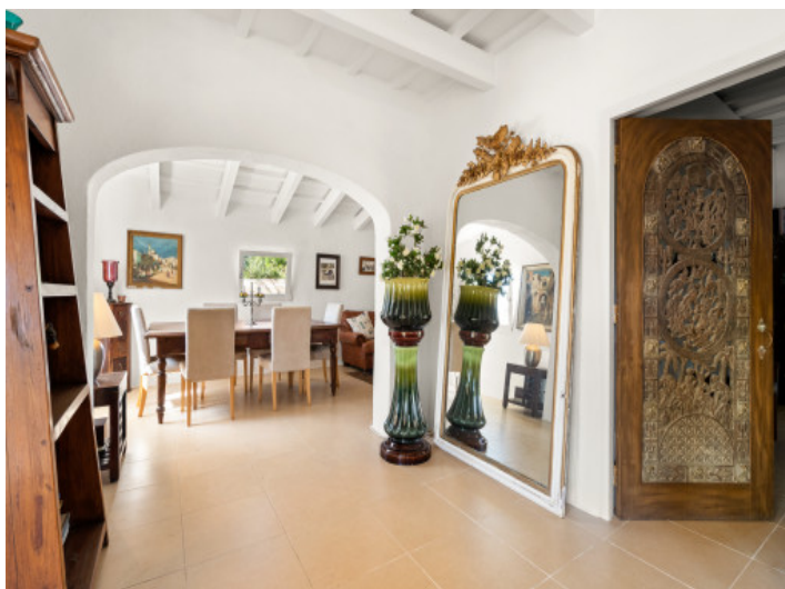
style typiquement menorquin