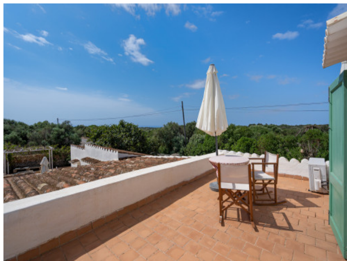
Terrasse sur le toit