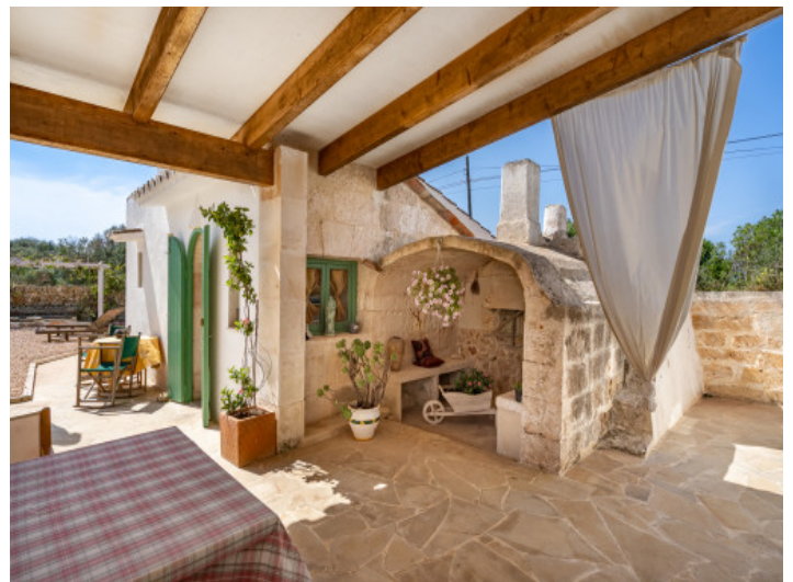
Maison d'hôtes avec terrasse

All information is correct to the best of our knowledge. Errors and prior sale excepted. This prospectus is purely for information purposes. Only the notarized deed of sale is legally binding.