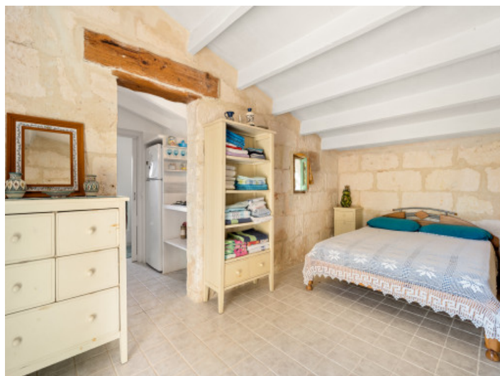
Chambre à coucher double

All information is correct to the best of our knowledge. Errors and prior sale excepted. This prospectus is purely for information purposes. Only the notarized deed of sale is legally binding.