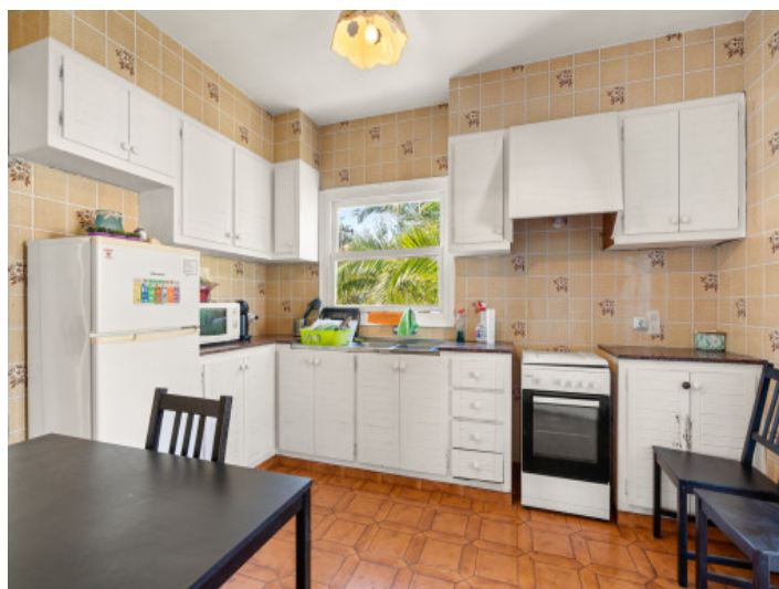
Bright kitchen with dining area