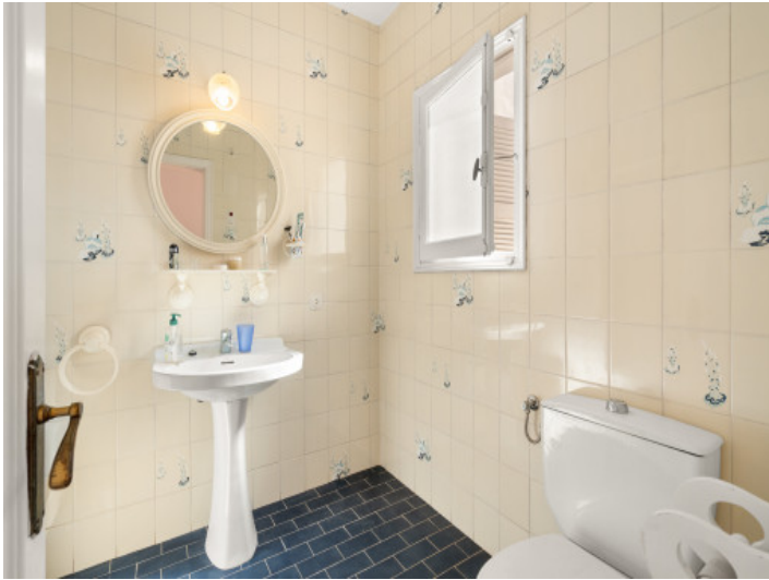
One of 3 bathrooms