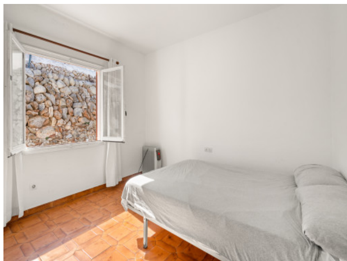
One of 4 bedrooms

All information is correct to the best of our knowledge. Errors and prior sale excepted. This prospectus is purely for information purposes. Only the notarized deed of sale is legally binding.