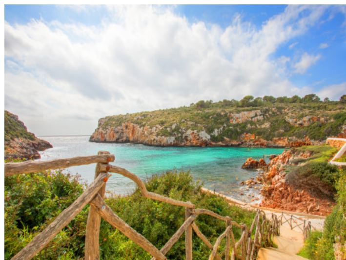
Access to the beach