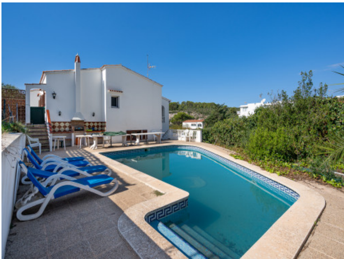
Pool area with many possibilities