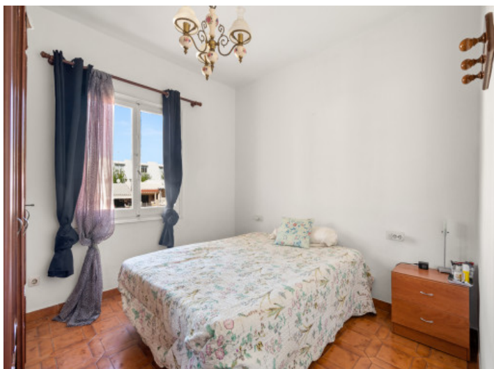
One of 4 bedrooms