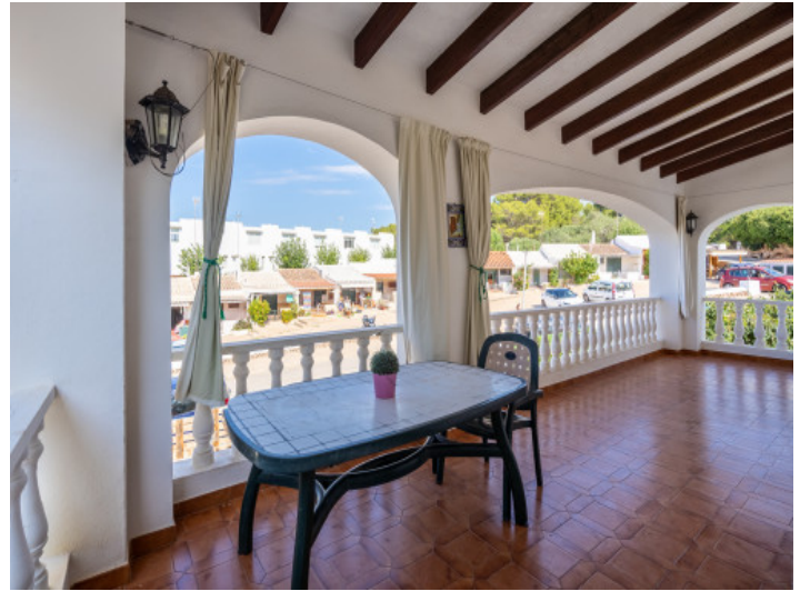
Large, covered terrace