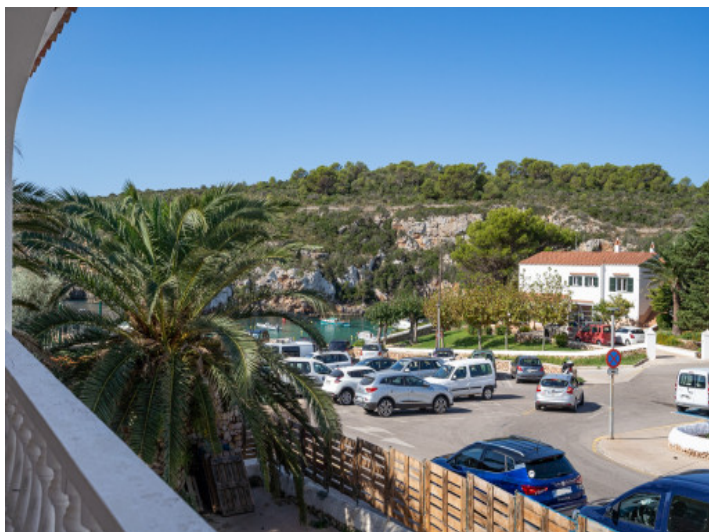
View to the sea from the terrace