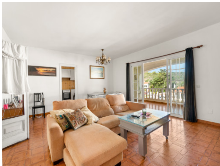
Lightflooded living and dining area