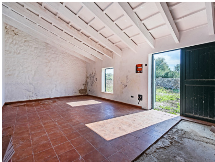
Entrance to the house