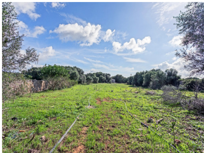
View of the plot