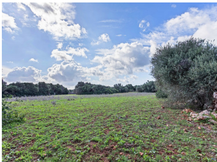
View of the plot