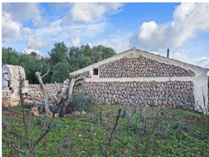
View of the stone facade