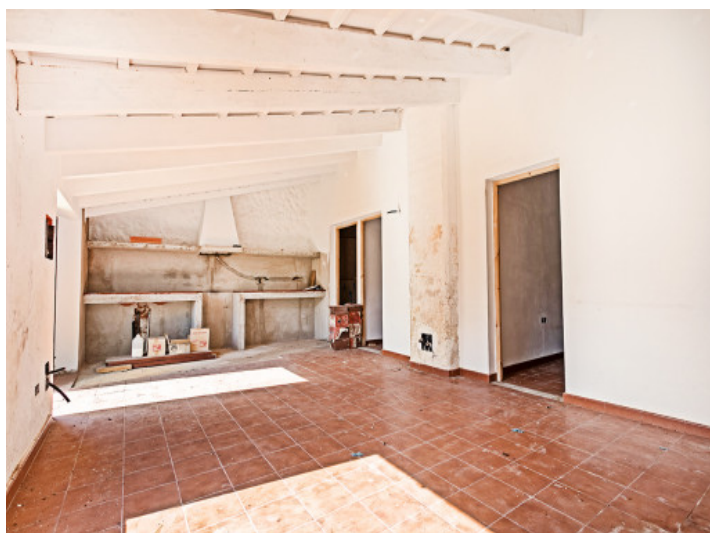
Large room with kitchen