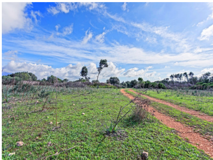
Large plot of 22 ha