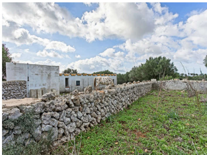
View of the plot

All information is correct to the best of our knowledge. Errors and prior sale excepted. This prospectus is purely for information purposes. Only the notarized deed of sale is legally binding.